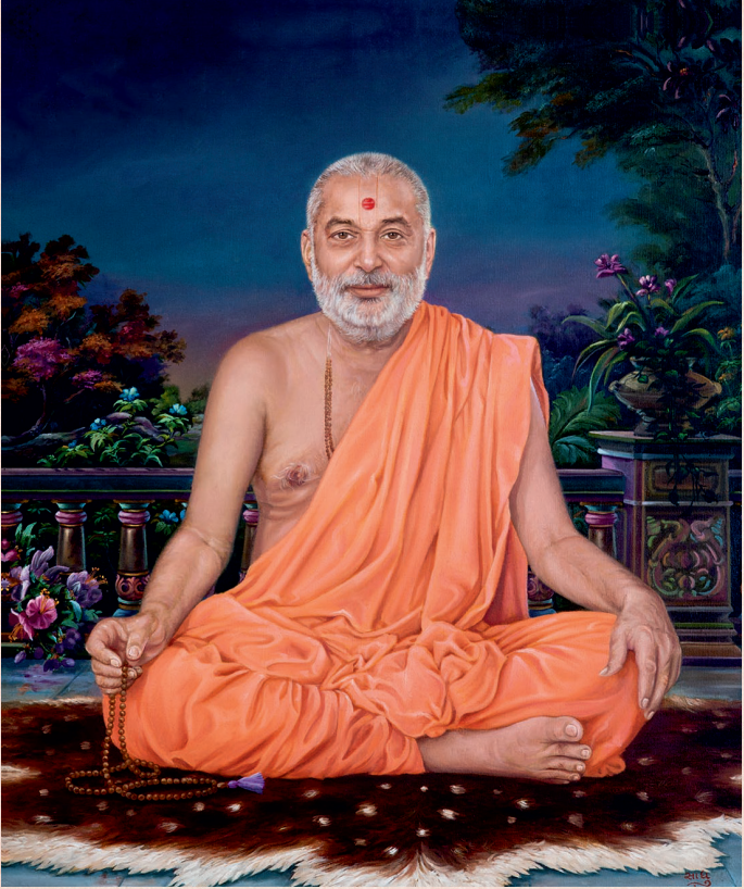
ब्रह्मस्वरूप श्रीप्रभुभस्वाभी महाराज