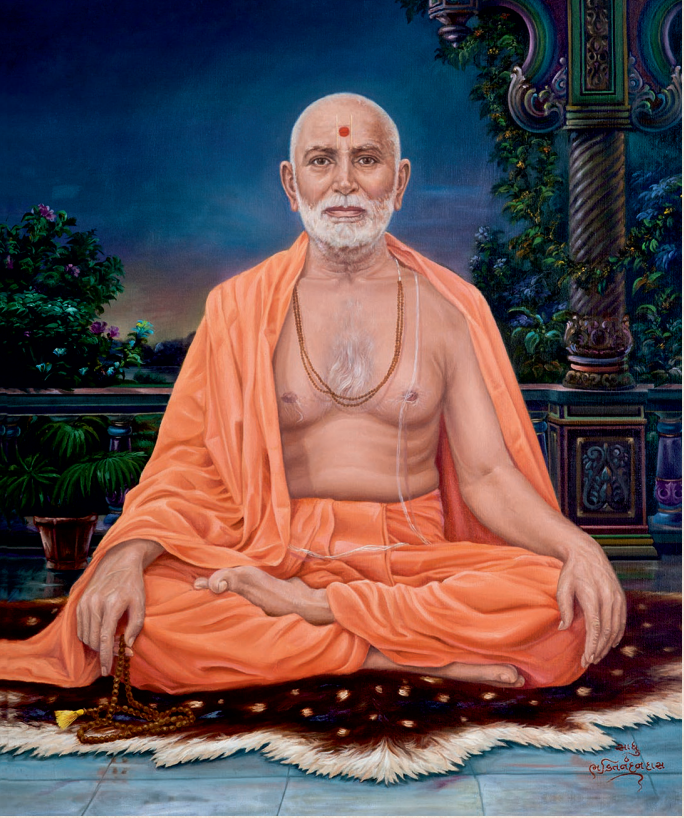
ब्रह्मस्वरूप श्रीशास्त्रीजी महाराज