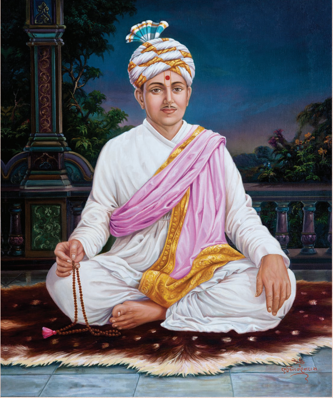
ब्रह्मस्वरूप श्रीमगतञ्च महाराज